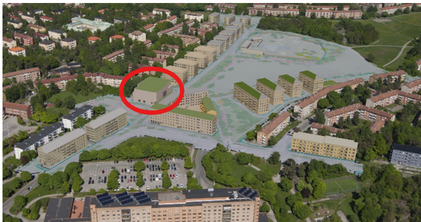
Flygbild över planområdet, illustration bebyggelseförslag på Nytorps gård från väster (kvarter B, idrottshallen inringad).

Författare: Lars Nordin Mathias Uhrner Louice Persson