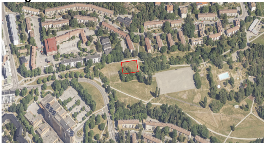
Kvarter B idrottshallen markerad yta (ej skalenlig), dpMap ortofoto.

Aktuell plats är en del av Nytorps gärde. Berörd fastighet är Hammarbyhöjden 1:1, ägd av Stockholms stad med exploateringskontoret som lagfaren ägare. Området ligger mellan Hammarbyhöjden, Björkhagen, Kärrtorp och Gamla Enskede. Området är en del av detaljplanläggningen för stadsutvecklingen som planeras på Nytorps gärde. Blåsut tunnelbanestation ligger cirka 700 meter västerut från idrottshallen.