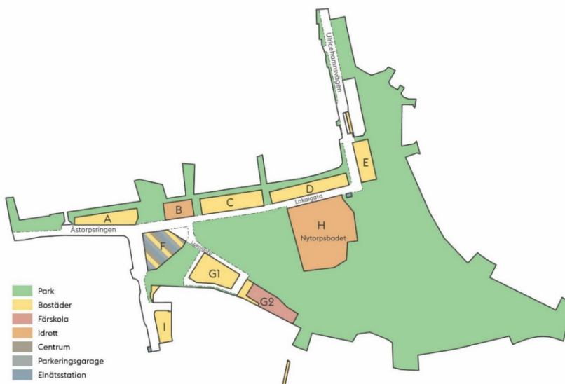
Översiktsbild från granskning av detaljplanen (2025) som visar olika funktioner inom detaljplaneområdet. Idrottshallen är kvarter B.

Idrottshallens huvudentré placeras i byggnadens sydvästra hörn som blir indraget, vilket skapar väderskydd. Entrétorg behöver samplaneras med intilliggande parkmark. På hallen östra sida är marknivån lägre och entrén är därför inte tillgänglig. Teknikrummet och miljöstationen nås via infarten på byggnadens östra sida. Öster om hallen skapas driftparkeringar samt lösningar för dagvattenhantering. Marken öster om byggnaden utreds som genomsläpplig för att hantera dagvatten.